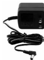
120 VOLT AC CHARGING ADAPTER

Controle el nivel de carga de la batería oprimiendo el botón de estado de la batería. El indicador LED de estado de carga mostrará el nivel de carga de la batería. Recargue la unidad cuando se encienda sólo una luz LED roja.