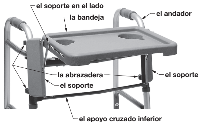
603900A Bandeja para Andador